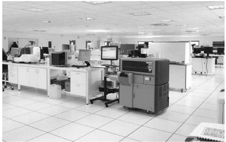
Nouveau plateau technique d'analyses médicales spécialisées du réseau BPR

afin d'assurer la fluidité des communications : identifier et suivre chaque patient au long de son parcours d'analyses, éviter les doubles saisies, réduire les risques d'erreur et raccourcir les délais ;