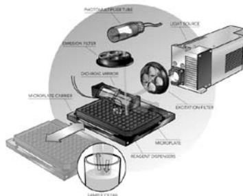
Figure 1 : système de mesure de fluorescence à filtres. Une transmission optique de l'ordre de 80% en excitation et émission fourni une sensibilité optimale.

Un système optique utilisant des filtres ( Figure 1 ) permet d'obtenir des niveaux de transmission lumineuse jusqu'à 80% dans le visible. En fluorescence, un tel système permet d'exciter efficacement les échantillons, et de récupérer une large portion du signal émis. Ceci est particulièrement important dans le cas d'applications où le signal est faible, telles que les mesures de polarisation de fluorescence, les mesures de fluorescence en temps résolu (TRF et TR-FRET), ou les dosages AlphaScreen®. Par ailleurs, les filtres optiques peuvent être conçus spécifiquement pour une application particulière : largeur de bande passante de quelques nanomètres à plus de 100 nanomètres, réflexion spectrale (blocage) spécifique, pente de transition adaptée, etc... Ils garantissent ainsi le plus haut niveau de performance pour les applications nécessitant la meilleure