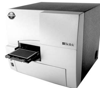
Figure 3 : Synergy 4, lecteur de microplaque multi-mode hybride.

Jusqu'à présent, les laboratoires considérant l'achat d'un lecteur de microplaque multi-mode devaient choisir entre ces deux concepts. Une récente enquête réalisée par la société HTStec ( www.htstec.com ) portant sur les lecteurs de microplaque multi-mode montre que les deux principaux facteurs techniques déterminant le choix d'un lecteur multi-mode sont la sensibilité du système (en terme de limites de détection), et la flexibilité du système (en terme de nombre de dosages différents réalisables). Or comme discuté ci-dessus, une sensibilité optimale est un attribut des systèmes à filtres, alors que la flexibilité est un attribut des systèmes à monochromateurs. Il apparaît donc qu'il est difficile de faire