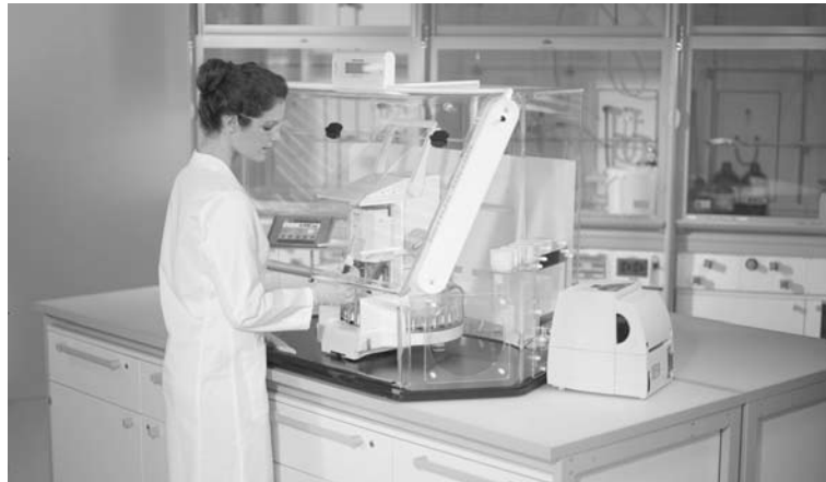
Quantos garantit rapidité, sécurité et productivité accrue pour le dosage de poudres.

→ Livrée dans une boîte de transport antichoc et étanche, chaque tête -et donc votre précieuse échantillon- est entièrement protégée. La boîte de transport évite aussi l'absorption d'humidité.