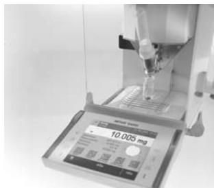
Le modèle QB1 offre une performance de mesure de 220 g avec une précision d'affichage de 0,005 mg

Cette nouvelle famille baptisée QUANTOS associe une tête de dosage à une unité de pesée, parfaitement adaptés l'un à l'autre grâce à une mécanique de haute précision et à une électronique intelligente.