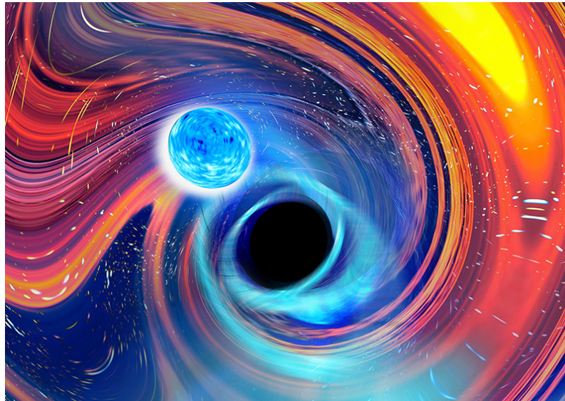
Vue d'artiste d'une fusion trou noir-étoile à neutrons.

3 Les deux signaux ont des niveaux de confiance différents. Même si celui de GW200105 n'est pas très élevé, la forme du signal et les paramètres qui en ont été déduits sont en faveur d'une origine astrophysique.